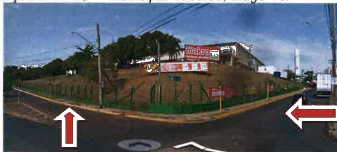
Imagem 1 – Visão geral das calçadas necessitando de plantio de árvores de médio porte

arborização urbana, lei municipal 4368/99, artigo 16.