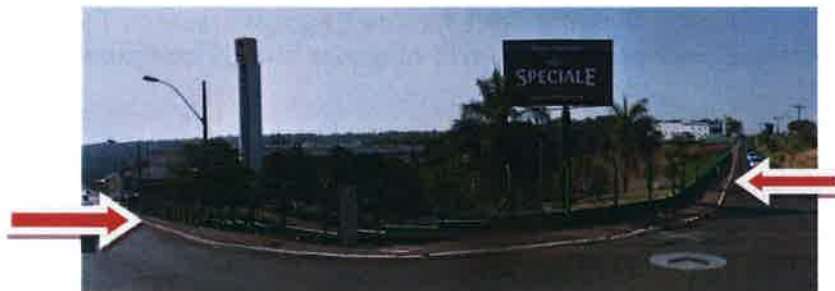
Imagem 2 – Visão geral das calçadas necessitando de plantio de árvores de médio porte