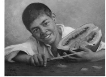
Figura 4 –Menino com melancia – Estevão da Silva - 1889. Óleo sobre tela. Pinacoteca do Estado de São Paulo

Indique a alternativa abaixo que concentra as obras selecionadas pelo(a) professor(a) a partir da leitura do texto pesquisado e que servem ao esse propósito.