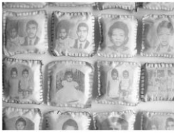
Figura 1 - Rosana Paulino, Parede de Memória (detalhe da instalação), 1994.

ligações artísticas entre Brasil, África” de Roberto Conduru. Nela se deparou com alguns artistas que, segundo o autor contribuem para esse fim.