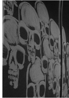
Figura 3- Ossário (Detalhe do Grafite)