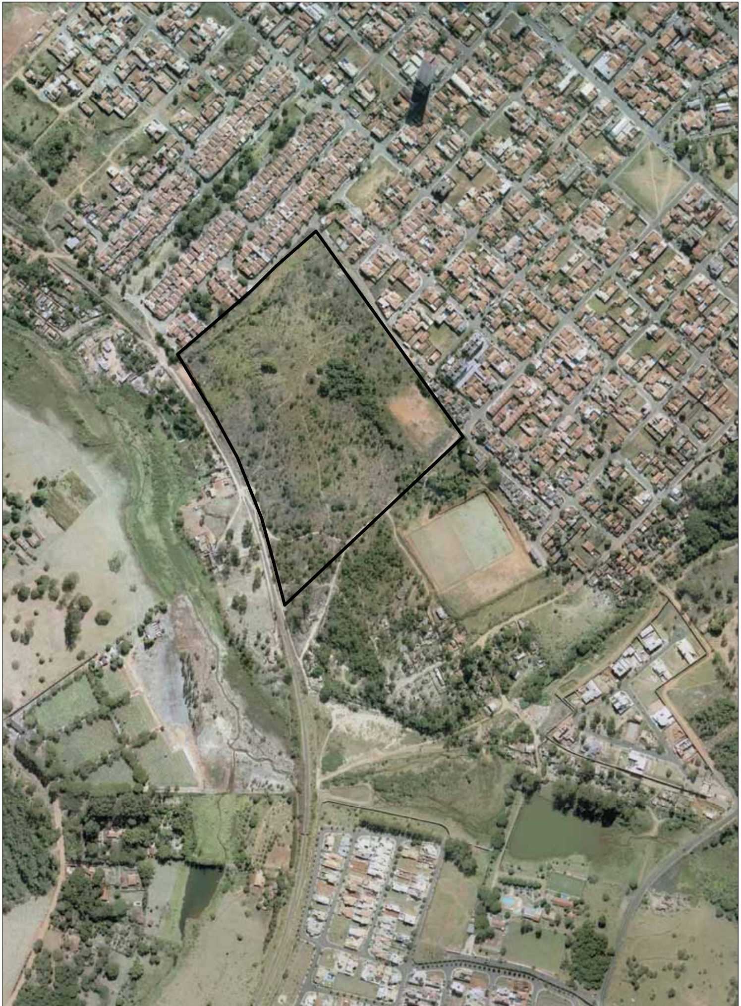
FOTO SATÉLITE 2010