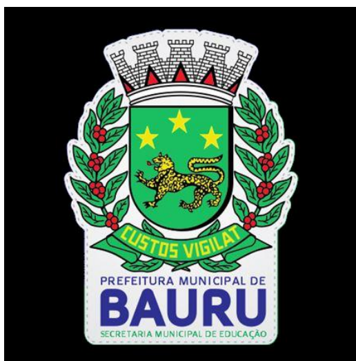
Mascara preta (Adulto)