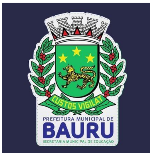
Mascara Azul (Infantil)

O brasão do município deverá ser estampado com o contorno branco conforme imagens acima.